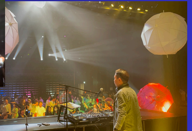
80's~90'sの洋楽邦楽問わずのヒット曲